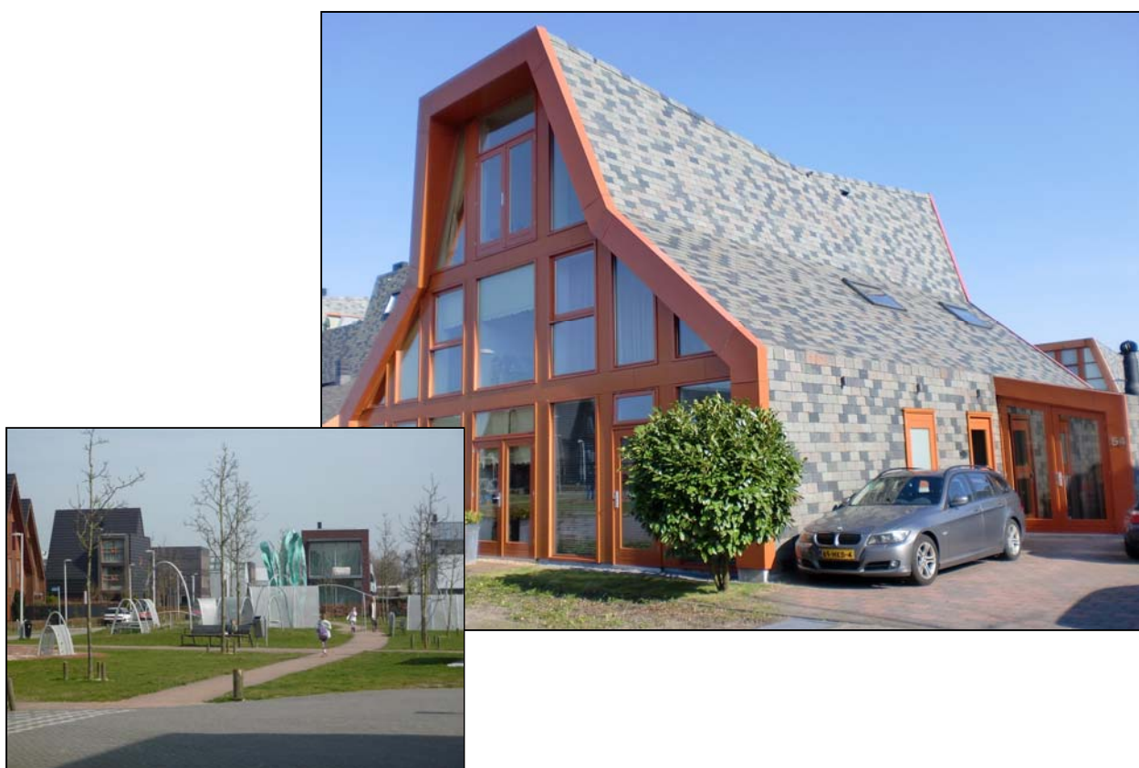
Bolwerk 54 te Vijfhuizen