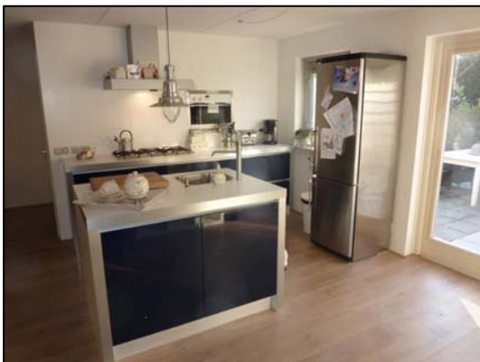
Keuken met spoeleiland

Het gezellige en fraaie dorp voegen daar alle goed aan toe.