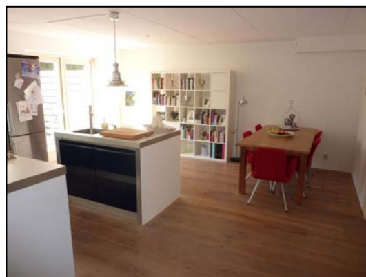
Woonkamer / eetgedeelte