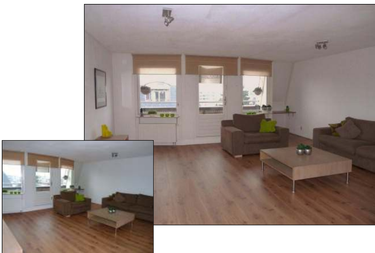
Molenstraat 30j te Schagen