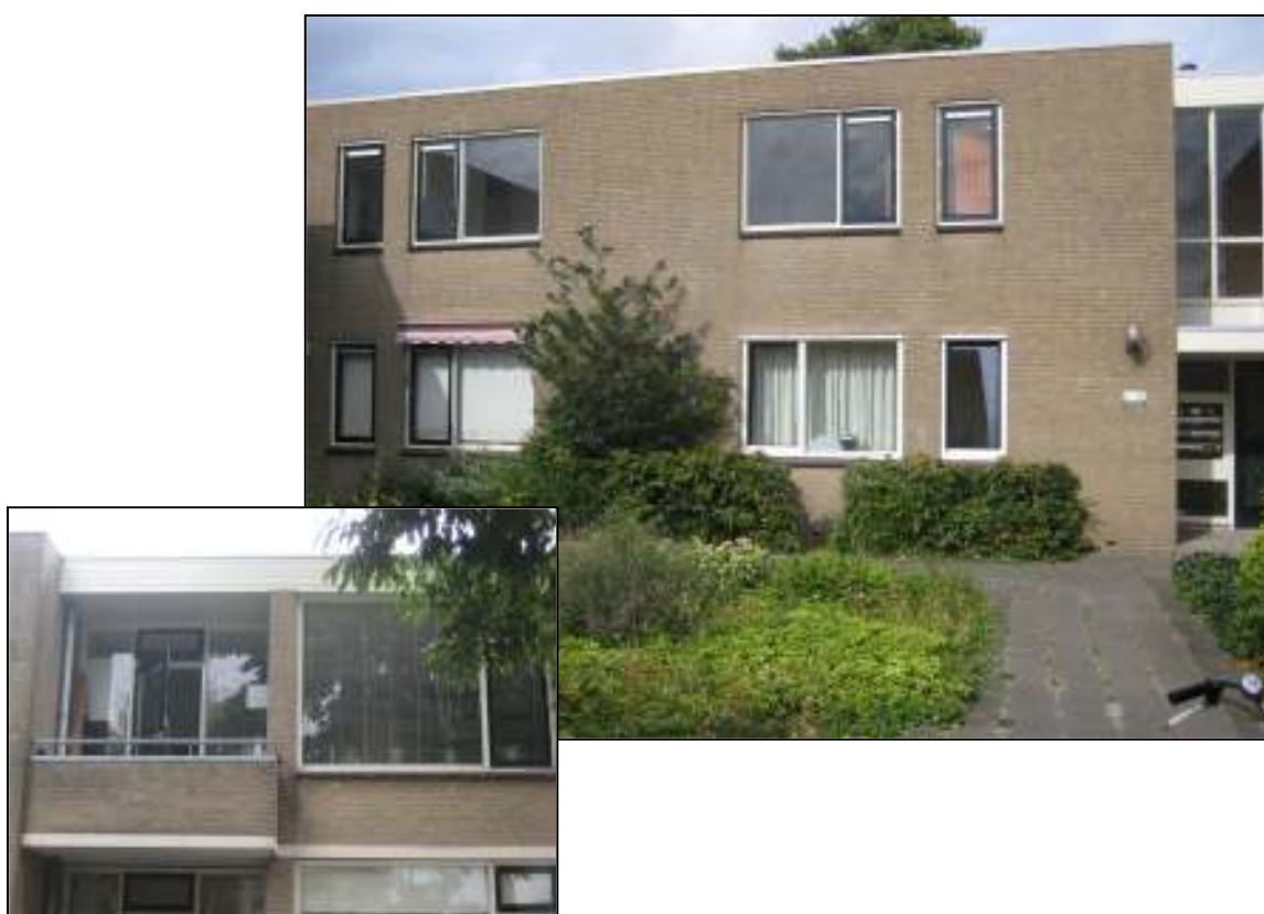
Bellinihof 16 te Alkmaar