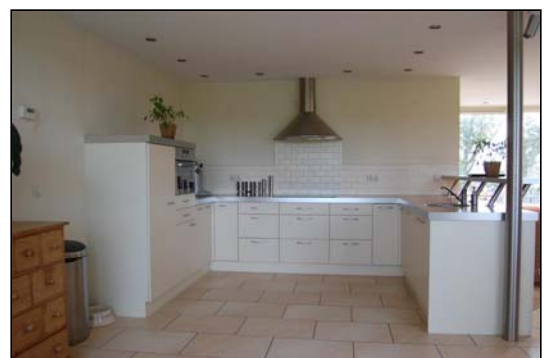
Luxe open keuken

De gegevens welke in deze brochure vermeld staan zijn zo zorgvuldig mogelijk samengesteld. Mochten er echter onjuistheden worden geconstateerd dan kunnen aan deze brochure geen rechten worden ontleend.